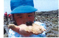
ちいさい「ウニ」みつけたよ〜

いそは、いわがゴツゴツしているうみべです。 いそには「うみのいきもの」がいっぱいすんでいます。ど んないきものがあるかじっくりみてみましょう。 いきものをきずつけないように、やさしくかんさつしたら そ〜と うみにかえしてあげましょう。